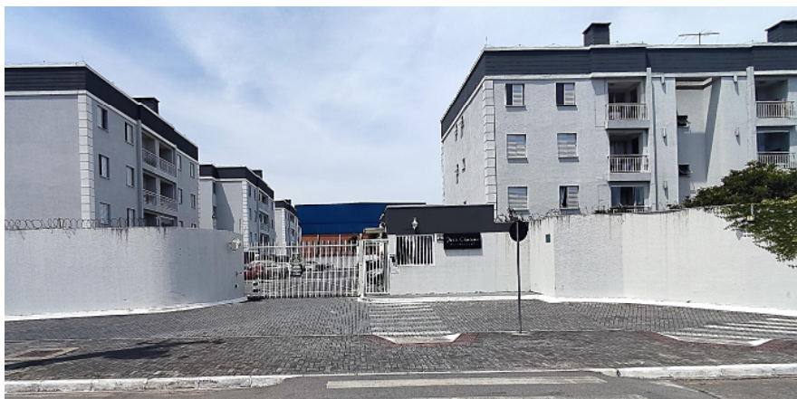
Frente do Condomínio